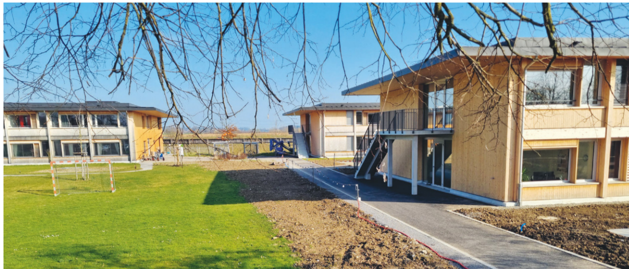
Die 3 Wohnhäuser mit insgesamt 10 Wohngruppen für Erwachsene und Kinder.

Das ganze Areal wurde seinerzeit mit einer Gas-/Ölheizung versorgt, welche letztmals im Jahr 1979 erneuert wurde. Im Rahmen der Gesamtanierung der Anlage wird auch die Heizung durch eine neue, umweltfreundliche Anlage ersetzt. In Zusammenarbeit mit der Technische Betriebe Weinfelden AG (TBW) wurde im letzten Jahr eine zukunftsweisende Lösung mit einem Anergienetz mit Grundwasser geplant und realisiert. Mit dem Grundwasser wird ein Anergienetz (Niedertempe-